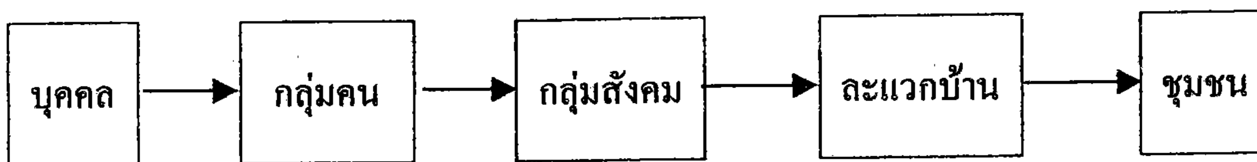
รูปที่ 2.2 กระบวนการเกิดของชุมชน