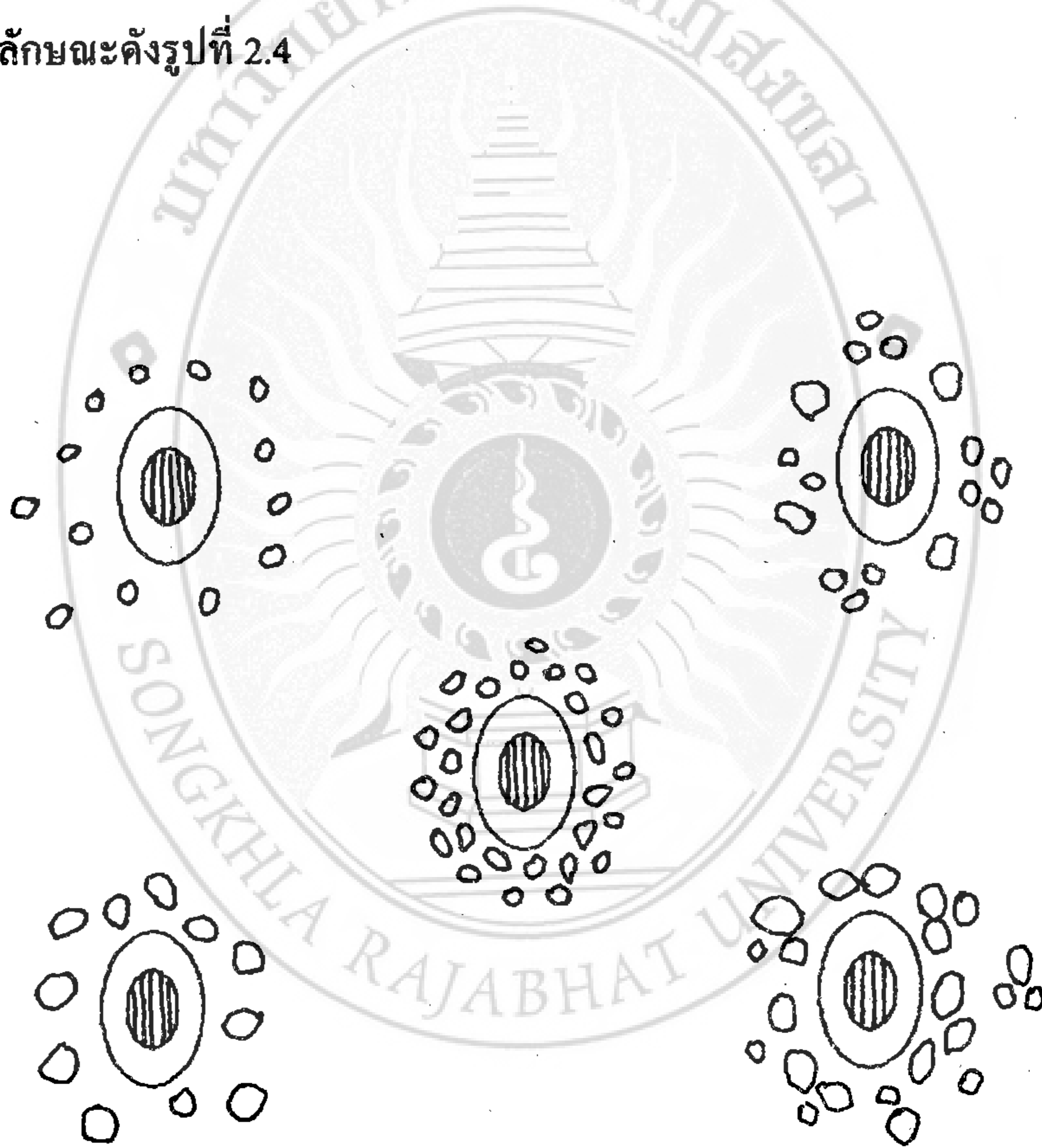
รูปที่ 2.4 ลักษณะของละแวกบ้าน

ละแวกบ้านจึงเป็นส่วนประกอบหนึ่งของชุมชนหรือเป็นชุมชนขนาดเล็กที่มีความสำคัญต่อการเกิด การดำรงอยู่ ความเจริญก้าวหน้า หรือความเสื่อมของชุมชน ลักษณะของละแวกบ้าน มีลักษณะดังรูปที่ 2.4